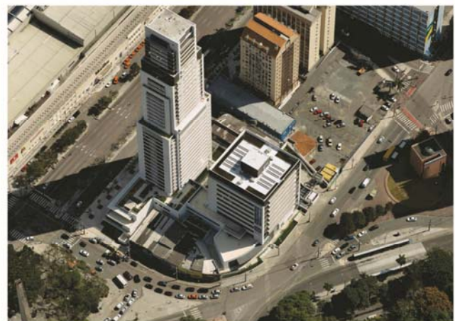
Modelo tridimensional da cidade fictícia de "Los Santos" do jogo GTA e, o real a partir de imagens oblíquas Leica RCD30 Penta de Curitiba

fotogramétrica cada dia mais será utilizada nas áreas de computação visual, inteligência artificial, direção assistida, realidade virtual, robótica, etc.