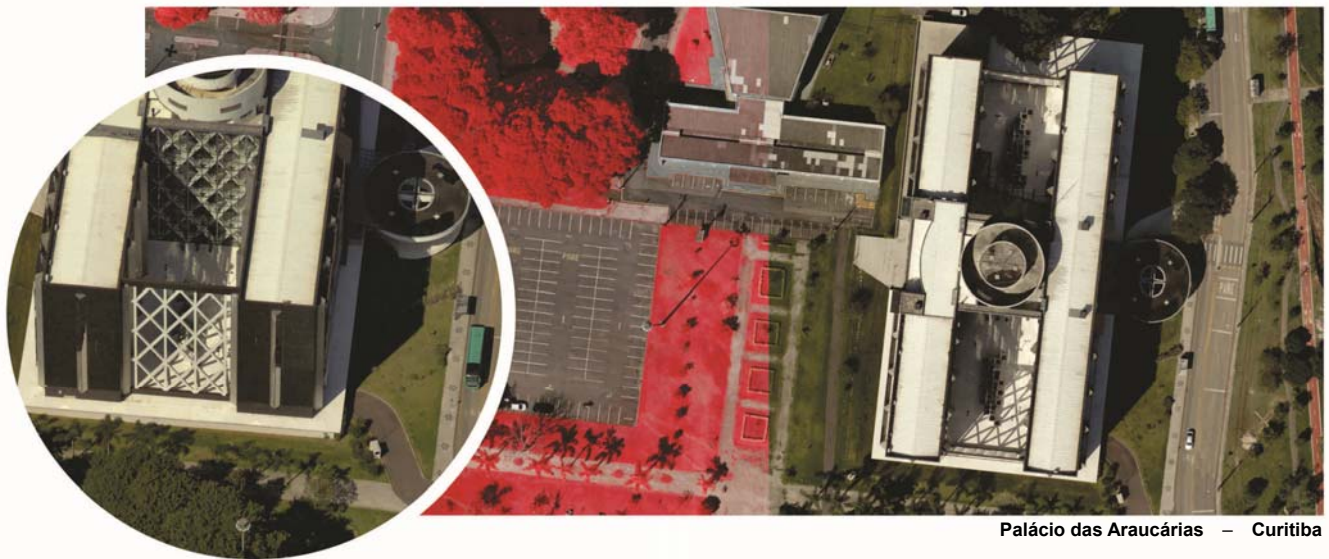
Palácio das Araucárias – Curitiba

É frequente nas minhas andanças e contatos com clientes a pergunta sobre como será o futuro da aerofotogrametria, ou simplesmente, o que virá pela frente. Aprendi com um dos fundadores da Esteio que estar atualizado tecnologicamente é condição sine qua non para não morrer no mercado – e esta busca deve ser constante. Embora estejamos passando por uma crise, ela não será eterna, e precisamos estar preparados para quando chegar ao fim.