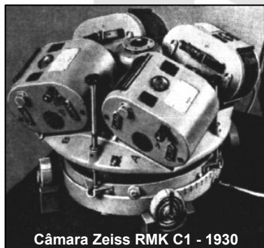
Câmara Zeiss RMK C1 - 1930

Definitivamente este não é assunto novo, pois esteve presente desde sempre na história da fotogrametria. É muito provável que a primeira fotografia aérea tenha sido uma imagem oblíqua